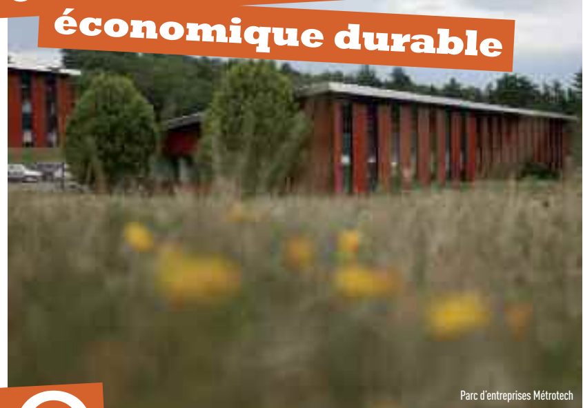
Parc d'entreprises Métrotech

O n le sait, la croissance économique ne peut être l'unique indice du bien-être économique et social du territoire. Tous les acteurs économiques (institutionnels, publics ou privés) doivent tendre vers un développement économique durable et favoriser l'émergence des filières créatrices d'emplois et de nouvelles richesses telles que les activités numériques, le design ou les technologies médicales.