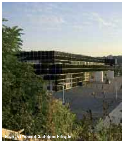
Musée d'Art Moderne de Saint-Etienne Métropole

Le coût d'investissement par Kwh est 4 à 5 fois moins élevé que dans la majorité des contrats de performance énergétique avec intervention sur le bâti. Saint Etienne Métropole dispose d'un prestataire unique et responsable, par un engagement capable de répondre dans des délais de réponse et de réalisation très courts.