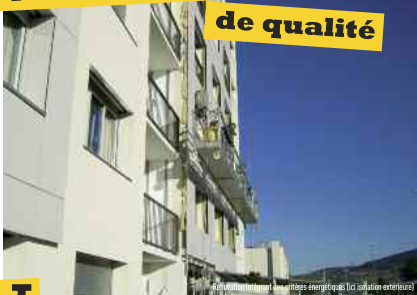
Rénovation intégrant des critères énergétiques (ici isolation extérieure)

I l n'est plus question de construire autrement qu'en limitant l'impact écologique de toutes les nouvelles constructions aussi bien qu'en tenant compte des nouvelles normes environnementales Européennes (avec notamment le niveau de performance BBC - Bâtiment Basse Consommation, visant à baisser la consommation énergétique moyenne des nouveaux logements).