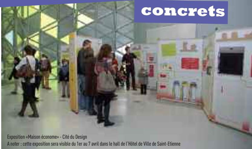
Exposition «Maison économe» - Cité du Design

A noter : cette exposition sera visible du 1er au 7 avril dans le hall de l'Hôtel de Ville de Saint-Etienne