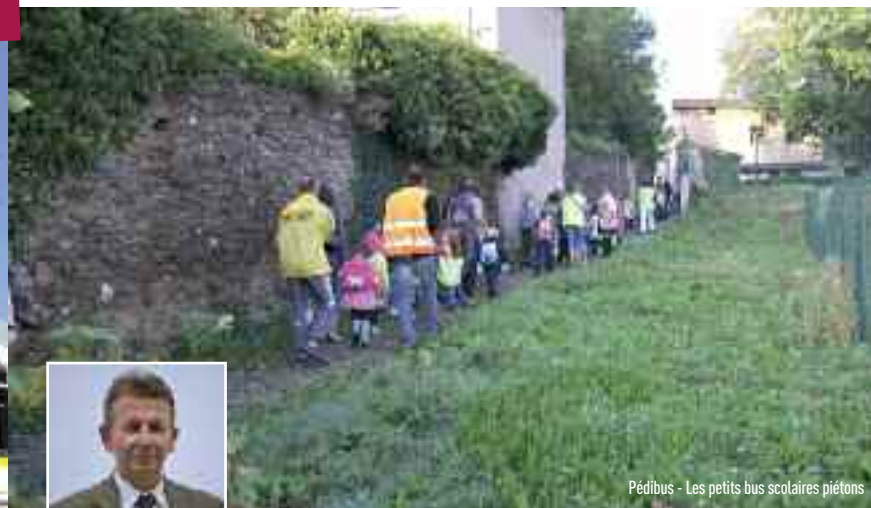
Pédibus - Les petits bus scolaires piétons

pas ou le vélo...) seront mises en place ainsi qu'un nouveau système de vélobus (petits bus à vélo pour les scolaires). L'agglomération agira également pour le développement du covoiturage, un système solidaire de déplacement, et la formation des conducteurs de transports en commun à l'éco-conduite, histoire de réduire l'impact énergétique des transports collectifs.