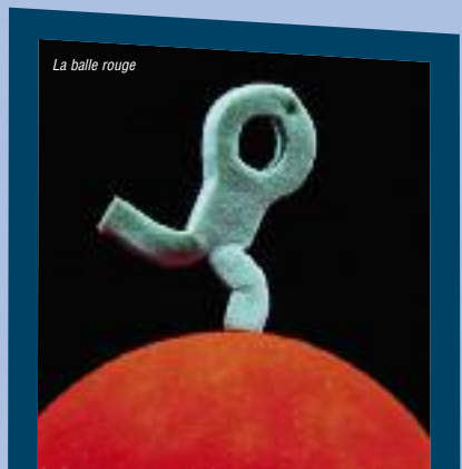
La balle rouge

Que ce Festival puisse offrir aux spectateurs de l'émotion, des joies, des rires, des interrogations...Mais aussi que chaque spectateur puisse se forger un esprit critique au contact des spectacles qui lui sont proposés.